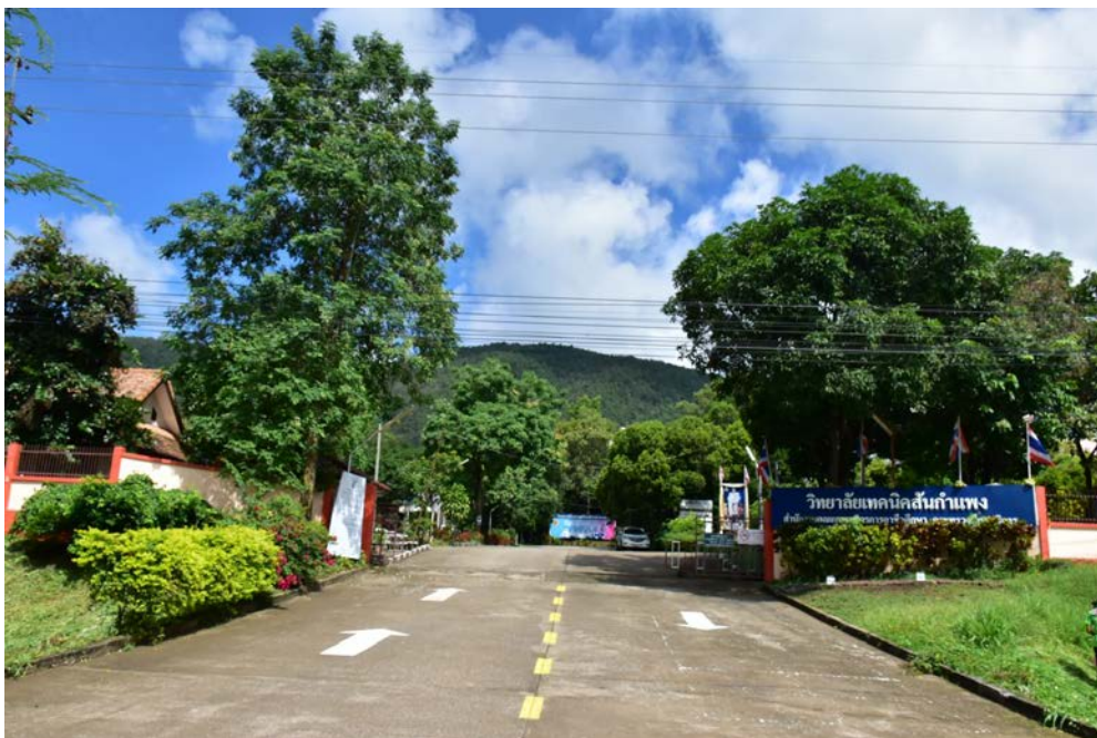
ภาพที่ ค.8 วิทยาลัยเทคนิคสกลนคร